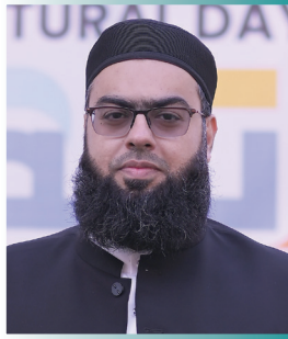
ڈاکٹر مفتی نعمان نعیم