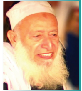
قاری عبدالکلیم رحمہ اللہ