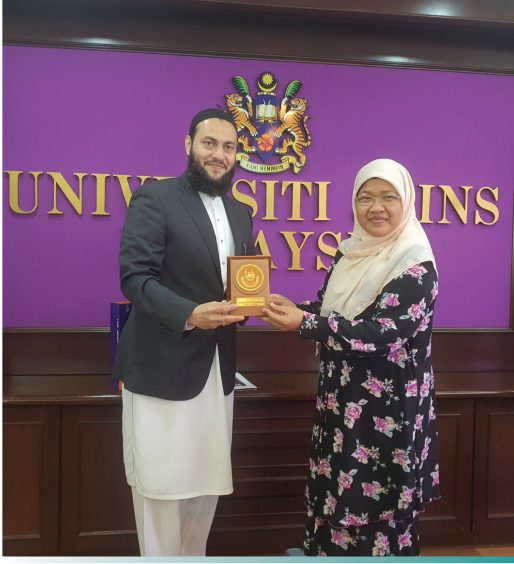
قطر ڈیبیٹ (QATAR DEBATES)

قطر ڈیبیٹ دراصل قطر فاؤنڈیشن کا ذیلی ادارہ ہے جس کے تحت عالمی سطح پر ہونے والی ڈیبٹس کے دو لیول ہوتے ہیں :