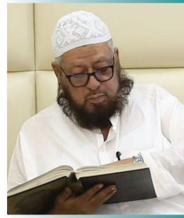
مفتی محمد نعیم رحمہ اللہ